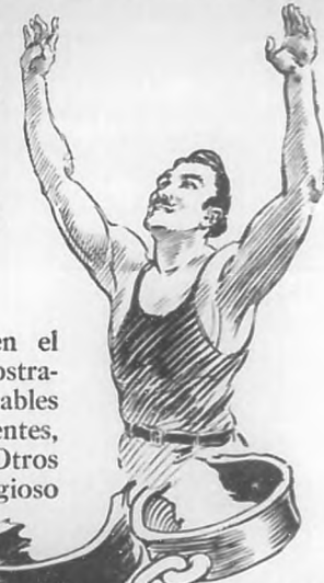
TANLAC, el Más Grande de los Remedios del Estómago, Vigorizador de los Nervios y Reconstituyente.

Los Sorprendentes Resultados en el Estómago y los Nervios le Demostrarán a Ud. por qué Innumerables Hombres y Mujeres Prominentes, Tanto de Aquí Como de Otros Muchos Países, Han Rendido Elogioso Tributo a TANLAC.