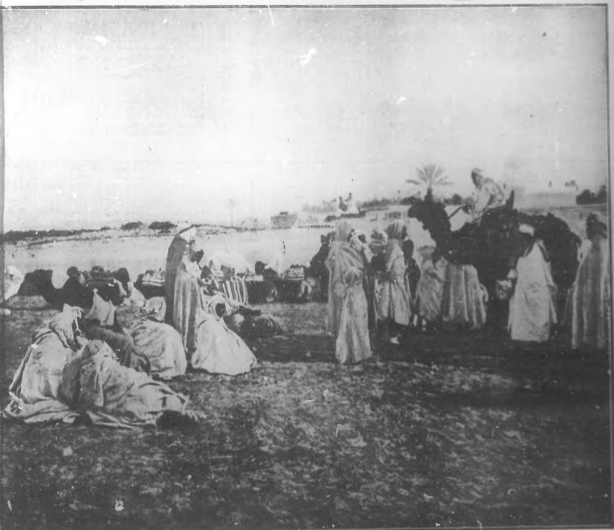
UN ALTO DE LA CARAVANA